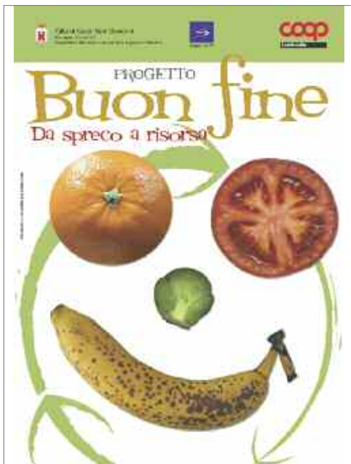
Pieghevole illustrativo del progetto “Buon fine” a Sesto San Giovanni (MI), anno 2006.

di criteri e buone pratiche per la progettazione sostenibile della grande distribuzione. Coop aderì al progetto e tra i criteri di sostenibilità propose la buona pratica della riduzione dei rifiuti anche attraverso il recupero delle eccedenze alimentari.